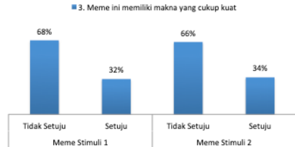
Gambar 6. Meme memiliki makna yang kuat (n=100)