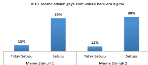
Gambar 13. Meme sebagai gaya komunikasi baru era digital (n=100)

Jika ditinjau berdasarkan meme yang dijadikan stimuli pada penelitian ini, maka disinyalir generasi milenials tidak akan terpengaruh atas meme yang beredar terkait pasangan calon presiden dan wakil presiden Indonesia tahun 2019. Kembali mengacu pada hasil analisis, mereka tidak melihat bahwa meme tersebut menambah keyakinan mereka bahwa kedua pasangan calon presiden dan wakil presiden cocok satu dengan yang lainnya. Dengan demikian maka dimunculkannya meme-meme politik, baik yang bersifat positif atau satire, diasumsikan tidak dapat mempengaruhi pilihan politik dari para generasi milenials tersebut. sehingga kampanye politik menggunakan meme untuk menysasar generasi milenials akan kurang efektif.