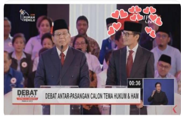
Gambar 1. Meme Stimuli 1