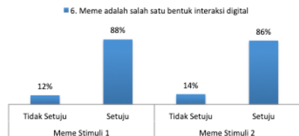
Gambar 9. Meme sebagai salah satu bentuk interaksi digital (n=100)