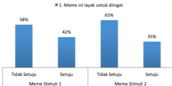
Gambar 4. Meme layak untuk diingat (n=100)

Menurut sudut pandang generasi milenials, meme tidak untuk diingat-ingat, meskipun mereka setuju bahwa meme memang menarik perhatian. Mayoritas generasi milenials juga tidak setuju bahwa meme dapat memiliki makna yang cukup kuat, apalagi informatif, dan membawa ujaran kebaikan. Meme menurut mereka cenderung satire dan bukan merupakan cara untuk meyakinkan khalayak terkait pesan tertentu. Meskipun demikian, hasil penelitian ini membuktikan fenomena yang berkembang, bahwa meme merupakan salah satu gaya komunikasi baru dalam interaksi digital (Gambar 4-13).