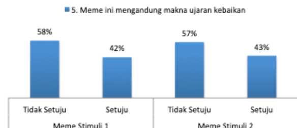
Gambar 8. Meme mengandung makna ujaran kebaikan (n=100)