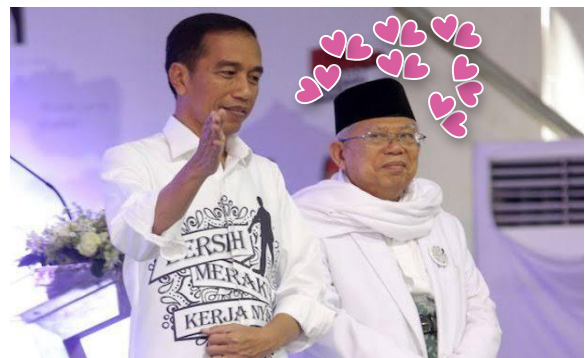
Gambar 2. Meme Stimuli 2

Setelah terpapar meme stimuli, selanjutnya PE diukur menggunakan indikator