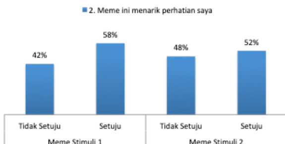
Gambar 5. Meme menarik perhatian (n=100)