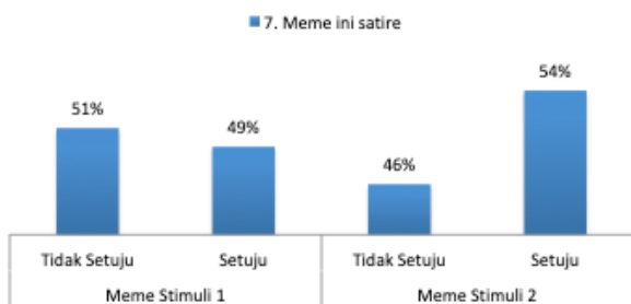
Gambar 10. Meme sebagai bentuk satire (n=100)

Hasil temuan tersebut, menegaskan bahwa generasi milenials sudah bisa memilah infomasi yang beredar di dunia digital, khususnya yang tertera dalam bentuk meme. Mereka sepakat untuk tidak terpengaruh meme dan cenderung melihat meme sebatas parodi digital yang diciptakan untuk meramalkan kejadian-kejadian tertentu.