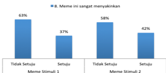
Gambar 11. Meme sebagai informasi meyakinkan (n=100)

Hasil temuan tersebut, menegaskan bahwa generasi milenials sudah bisa memilah infomasi yang beredar di dunia digital, khususnya yang tertera dalam bentuk meme. Mereka sepakat untuk tidak terpengaruh meme dan cenderung melihat meme sebatas parodi digital yang diciptakan untuk meramalkan kejadian-kejadian tertentu.