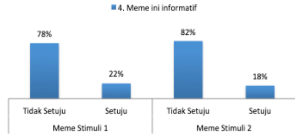
Gambar 7. Meme informatif (n=100)