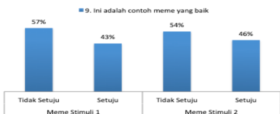
Gambar 12. Meme sebagai contoh yang baik (n=100)