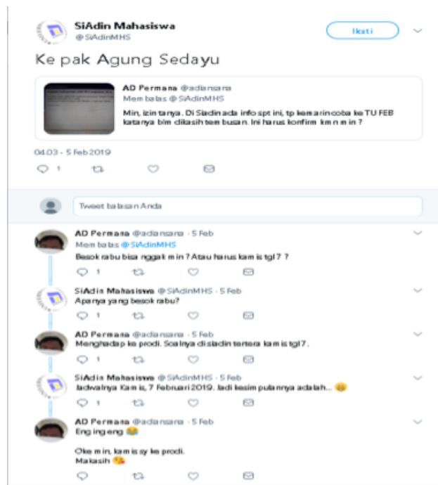
Gambar 1. Personalisasi Pesan Twitter

Berdasarkan gambar diatas, keluhan administrasi berkaitan dengan unit lain di Universitas, kemudian ditindaklanjuti kepada pihak bersangkutan. Hal ini sesuai dengan hasil wawancara dengan Wakil Rektor IV yang menyatakan bahwa :