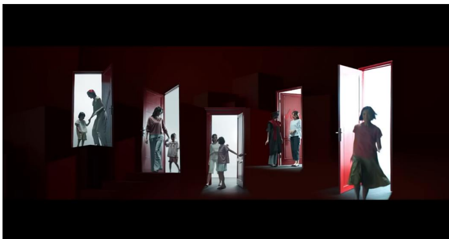
Gambar 5. Adegan Kompilasi Pertumbuhan Anak

Adegan ini berlatar di ruang makan yang dipenuhi perlengkapan belajar anak, seperti pensil warna, buku, tas, dan boneka. Ruang makan tersebut langsung menghadap ke area dapur yang didominasi oleh warna hijau, dengan pencahayaan alami dari sinar matahari yang masuk ke sebagian area ruang makan.