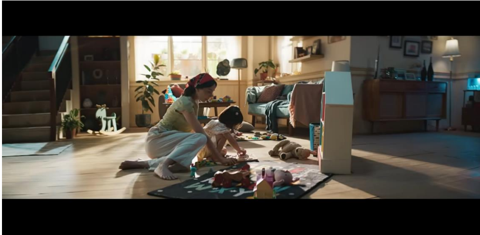
Gambar 7. Adegan Ingatan Sang Anak bersama Ibu

dapur, melainkan juga mencakup keterlibatan dalam pusat inovasi dan perkembangan teknologi. Hal ini menjadi bentuk penegasan terhadap pentingnya kesetaraan gender dan upaya pemberdayaan perempuan sejak usia dini.