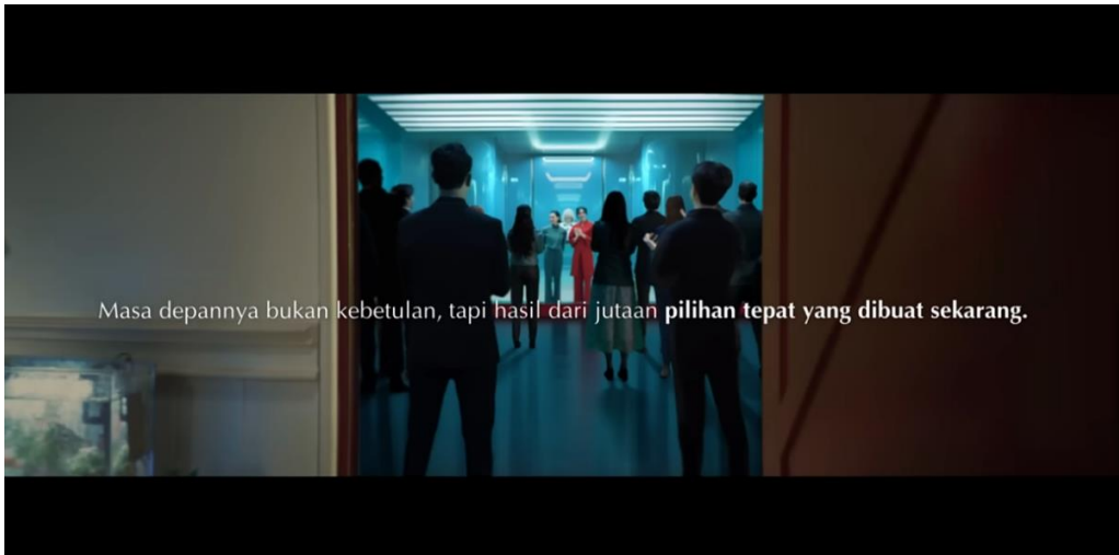
Gambar 8. Pesan Penutup Iklan Morinaga

Gambar 8 memperlihatkan adegan penutup iklan susu Morinaga tahun 2025. Adegan ini menampilkan sosok ibu bersama anak perempuannya berada di sebuah ruangan berteknologi tinggi dengan desain futuristik dan dominasi warna biru, yang menciptakan kesan modern dan canggih. Di sekitar mereka, tampak sekelompok orang berkumpul dengan antusiasme, mengapresiasi hasil karya yang telah dihasilkan oleh sang anak perempuan.