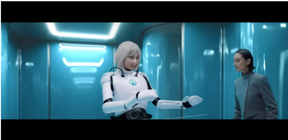
Gambar 6. Adegan Sang Anak Mengembangkan Robot

Sang ibu tampil dengan postur tubuh yang tegap dan langkah yang mantap, menggambarkan perannya sebagai penuntun atau pemimpin dalam perjalanan tersebut. Gerak tubuhnya menunjukkan keyakinan dan kesiapan dalam menghadapi setiap tahap kehidupan. Di sekitarnya, tampak anak-anak yang mengikuti langkah sang ibu, mencerminkan hubungan yang dekat dan dinamis antara ibu dan anak seiring berjalannya waktu.