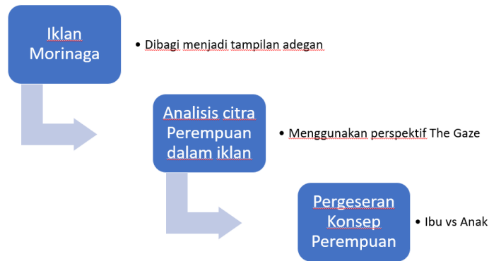
Gambar 1. Alur Penelitian (Sumber: Dokumentasi Pribadi, 2025)