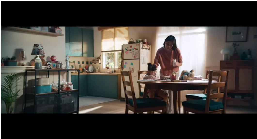
Gambar 4. Visual Ibu dan Anak di Meja Makan

Gambar 4 memperlihatkan adegan iklan pada detik 24. Iklan memperlihatkan visual seorang ibu yang menepuk pundak anak perempuannya sebagai isyarat untuk memberikan segelas susu. Anak tersebut kemudian menoleh ke arah ibunya. Sang ibu tampak tersenyum, sementara si anak terlihat fokus mewarnai dengan pensil warna.