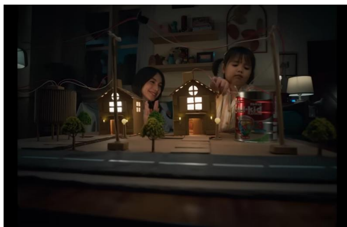
Gambar 3. Awal Iklan Menampilkan Ibu dan Anak

Analisis citra dalam iklan ini dilakukan dengan meninjau gestur, aktivitas, ekspresi, serta latar adegan. Berikut adalah sejumlah cuplikan adegan yang telah dikumpulkan untuk keperluan analisis lebih lanjut