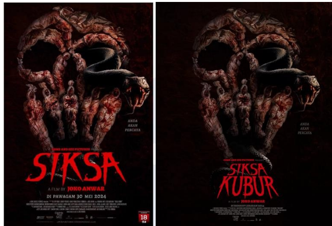
Gambar 2. Poster film Siksa Kubur (2024) versi Malaysia (kiri) dan Indonesia (kanan)

Di Malaysia, proses distribusi film tunduk pada regulasi yang ditetapkan oleh Lembaga Penapis Filem (LPF), di mana setiap film wajib memperoleh persetujuan sensor sebelum dapat diputar secara publik. Film Siksa Kubur (2024) karya Joko Anwar, mengalami perubahan judul menjadi Siksa sebagai bentuk kepatuhan terhadap ketentuan dalam Akta Penapisan Filem 2002 (Akta 620), khususnya Bagian III Seksyen 11 yang mengatur tentang penyensoran dan penyuntingan film. Perubahan tersebut dilatarbelakangi oleh muatan tematik dan simbolik dalam film yang merujuk pada ajaran Islam. Sebagaimana yang terdapat dalam artikel portal news dengan judul Sajaul Al-Aqra, Ular yang Menemani Alam Kubur Orang-orang Lalai Salat dijelaskan bahwa unsur visual berupa ular dalam poster film tersebut melambangkan figur Syuja'ul Aqra , makhluk dalam kepercayaan Islam yang ditugaskan untuk menyiksa orang-orang yang lalai dalam melaksanakan shalat (Setya, 2022). Berdasarkan Garis Panduan LPF, referensi visual poster dan korelasi dengan konten film ini yang dikemas dalam genre horor dinilai melanggar aspek keagamaan (Seksyen 2.1) karena berpotensi membawa keraguan terhadap akidah serta mengasosiasikan ajaran Islam dengan unsur kekerasan dan terror (Akta Penapis Filem, 2002).